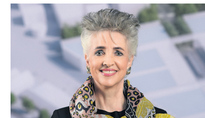
Regierungspräsidentin Carmen Walker Späh, Volkswirtschaftsdirktorin

Eine grobe Kostenschätzung für das Gesamtpaket (Glattalbahn-Verlängerung, Hochwasserschutz, Velohauptverbindung) zu Beginn des Vorprojekts 2018 ging von mindestens 300 Millionen Franken aus. Ziel des Vorprojekts ist es mitunter, den